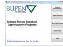
Sufen Network Programı Önyüzü