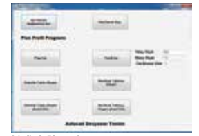
Sufen Plan Profili Programı Önyüzü