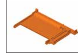
3 Boyutlu Regülatör Çizimi

SUFEN NETWORK yazılımı ile Sulama şebekeleri optimizasyonu sağlanmaktadır