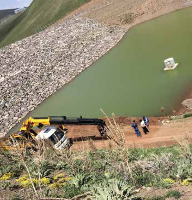
Müşavirliği Yapılan Gölet İnşaatı

DORÇE Yapı - TANAP Ankara ve Yozgat Sahası Yağmursuyu Uygulama Projelerinin Hazırlanması Caprice Gold Gayrimenkul - Caprice Gold İstanbul Çevre İşleri Uygulama Projeleri