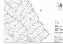
Sufen Plan Profili Programı ile Oluşturulan Genel Vaziyet Planı