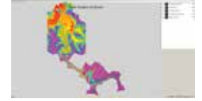
Baraj Yıkılma Analizi Modeli - RİO2d